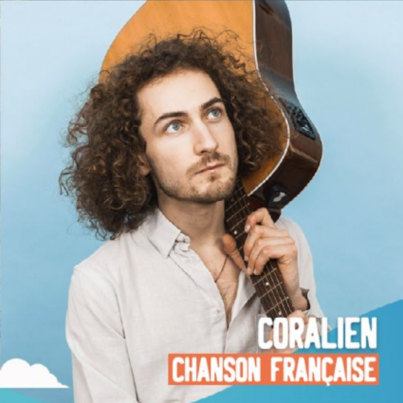
CORALIEN CHANSON FRANÇAISE