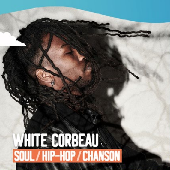
WHITE CORBEAU SOUL / HIP-HOP / CHANSON