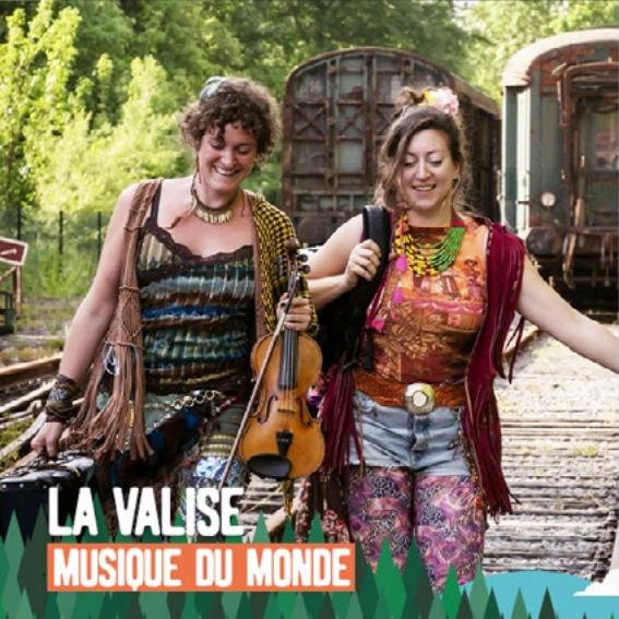
LA VALISE MUSIQUE DU MONDE