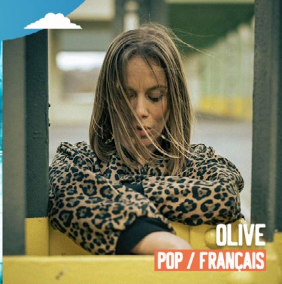
OLIVE POP / FRANÇAIS