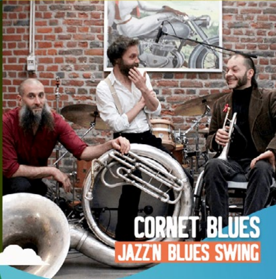
CORNET BLUES JAZZ'N BLUES SWING