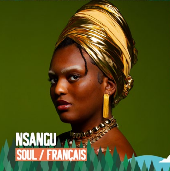
NSANGU SOUL / FRANÇAIS